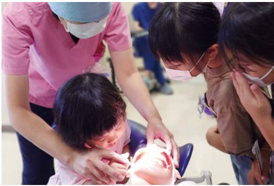
ちゃんと綺麗にしているかな？（歯石落とし体験）