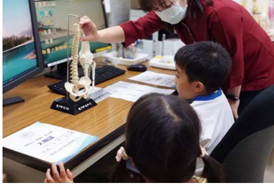
どこの骨でしょうか！（骨と部位を覚えよう！）