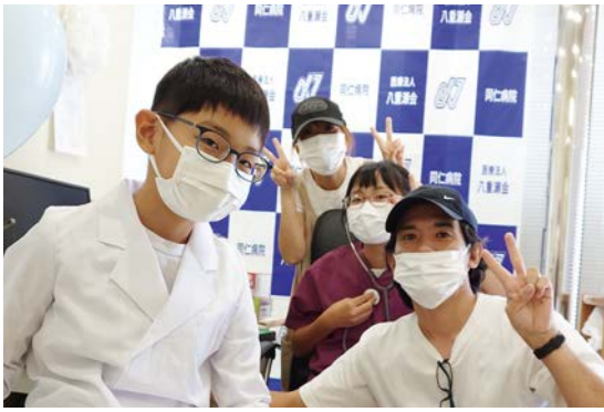
白衣で家族と記念撮影！（ユニフォーム試着コーナー）