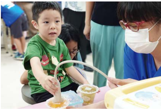
なにが見えるんだろう・・・（超音波検査体験）

ふれあい祭り医療体験フ エア（ふれあい祭り）は、 平成2年に1回目が開催さ れました。その趣旨は患者 さん、ご家族の皆様とのふ れあい、地域の皆様とのふ れあい、そして同仁病院の 創立記念と職員間のふれあ いを基本としております。