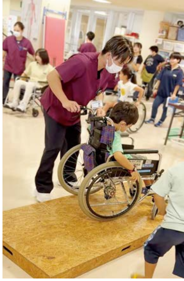
車椅子も意外と大変だね！（リハ体験）

ふれあい祭り医療体験フ エア（ふれあい祭り）は、 平成2年に1回目が開催さ れました。その趣旨は患者 さん、ご家族の皆様とのふ れあい、地域の皆様とのふ れあい、そして同仁病院の 創立記念と職員間のふれあ いを基本としております。