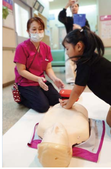
もしもし亀よ〜のリズムで♪（看護師体験）