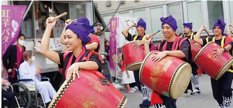
ひーやっさっさ〜！（職員エイサー演舞）